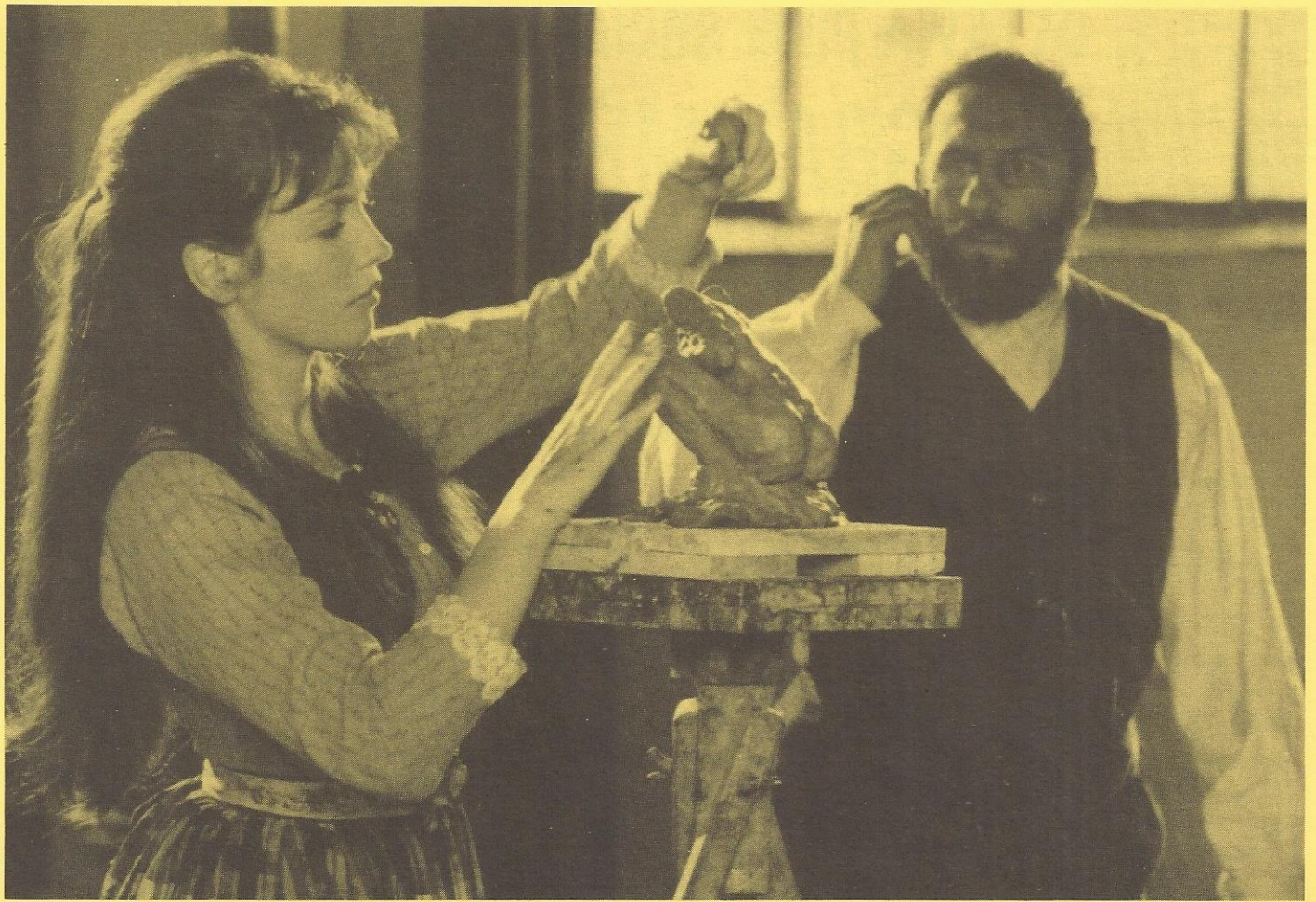
Isabelle Adjani and/et Gérard Depardieu in/dans Camille Claudel